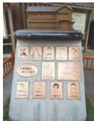
記念碑 「トキワ荘のヒーローたち」