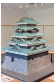
「最寄り駅」大手町駅(東京メトロ丸の内線、東西線、千代田線、半蔵門線、都営三田線)

家康から続く徳川將軍家の居城だったのが江戸城です。現在の皇居一帯にありました。元々ここには鎌倉幕府に仕えた江戸氏の館があったと言われており、その跡地に室町時代後期の武將、