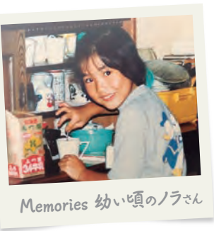
Memories 幼い頃のノラさん