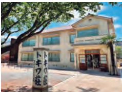
昭和を代表するマンガ家たちが 若手時代を過ごしたトキワ荘