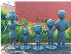
美術館の隣にある サザエさん公園の銅像も お見逃しなく