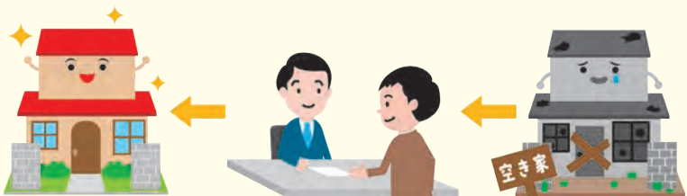
相続不動産は正しく登記して、適切な管理が大切

所有者不明土地に関連し、法律が改正されましたが、不動産の適切な管理がなされないことよって近