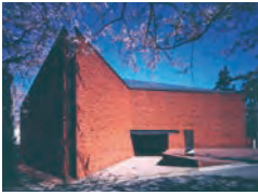
静かな住宅街に佇む こだわりの美術館

マンガやアニメと言えば、今や日本が誇る文化として世界中で愛されています。数々の作品が生まれた東京都内の町、作品の世界観を味わえるスポットをご紹介します。